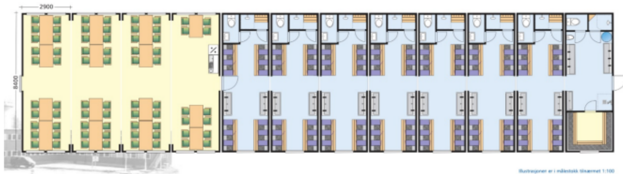
Illustrasjonen er i indretekst størrelse 1:100

På rigg for inntil 36 personer eller mer kan 1 skifte- og vaske-brakke sløyfes når inngangsbrakke inngår i riggen. Inngangs-brakke skal inneholde WC, dusj, 6 tappesteder, grovvask, urinal og tørkerom.